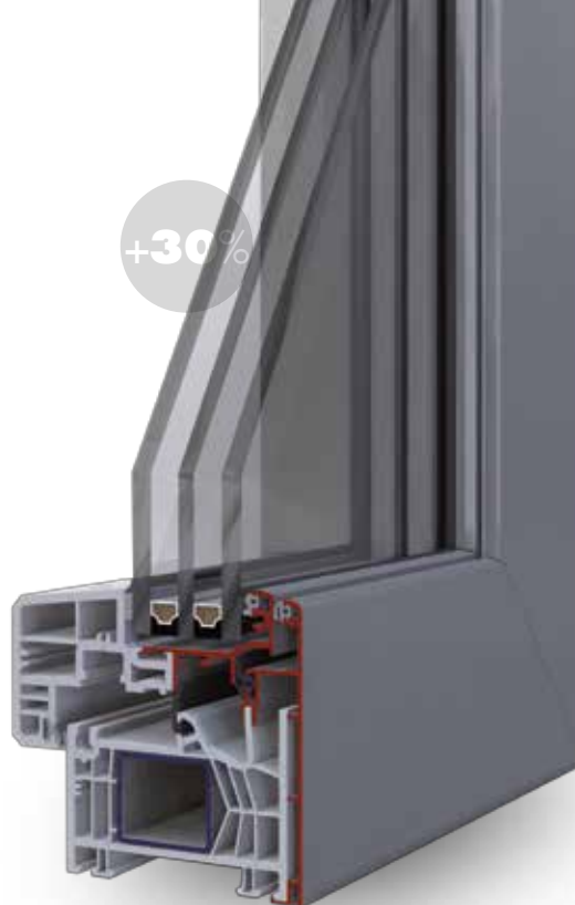
GLASS Anta a scomparsa +30% di superficie vetrata

Classe E1050 Non presenta infiltrazioni d'acqua in presenza di vento fino a a 145 Km/h