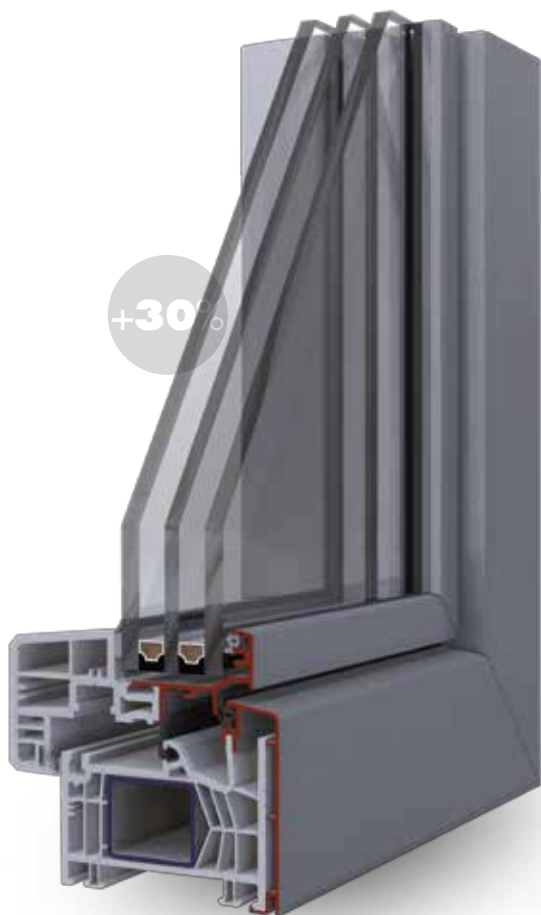
SLIM Anta a semi scomparsa +30% di superficie vetrata